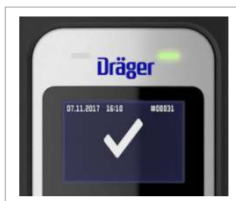
Символ "Алкоголь не виявлено"