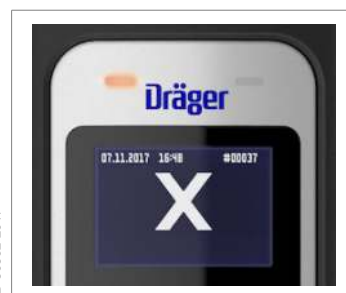
Символ "Виявлено алкоголь"