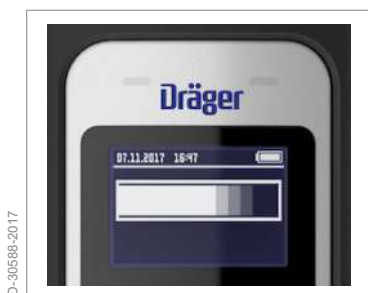
Символ "Рівень виконання тесту"