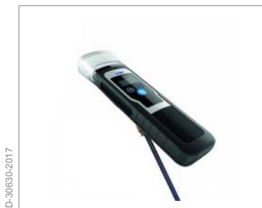
З'єднувач 1/4" для кріплення телескопічної рейки