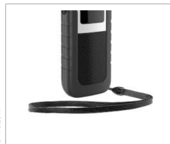
Зап'ясний ремінь для надійного утримання