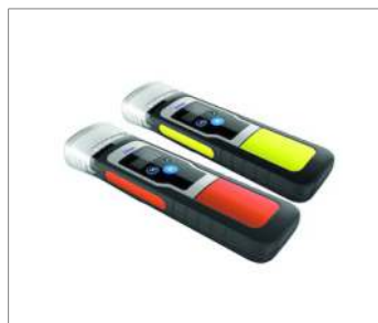
Додатковий набір світловідбивних плівок (жовтий або помаранчевий)